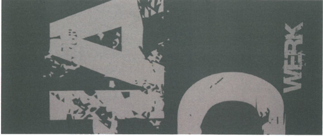
Schulbuchverlag, Leipzig, 1988, S. 100, 101