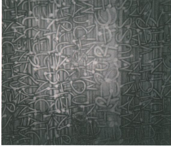
Schriftmuster | Fotobuchschiff mit Lack