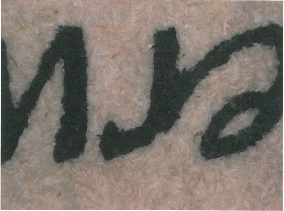
Schulbuchverlag, Leipzig, 1988, S. 100, 101