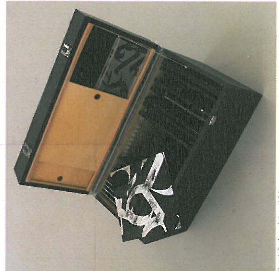
Musterwörter der van der Meer'schen Kollektion