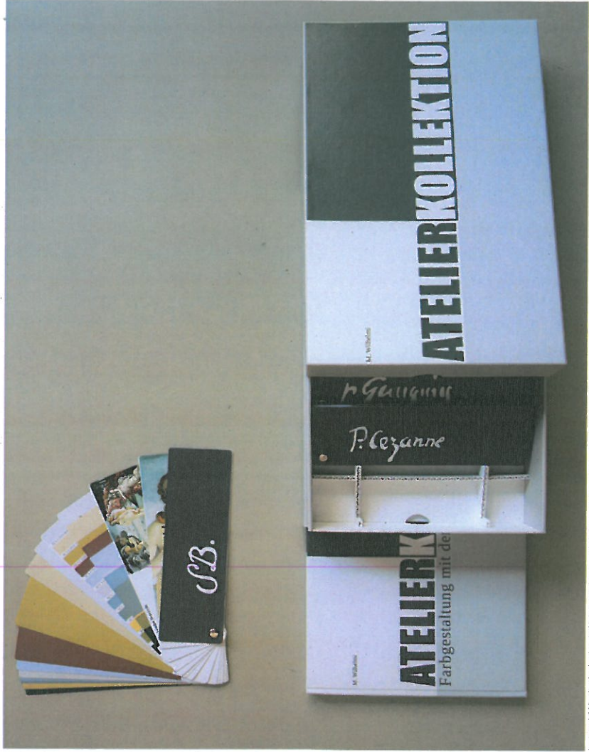
Leistungsbild für die Abgabe: des schriftlichen Ausarbeitung - Schuber mit der Broschüre und in Farbfächerordnern