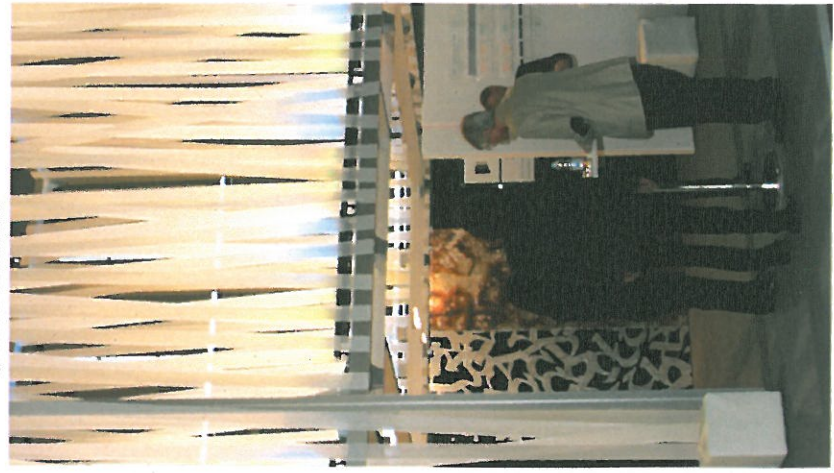
Präsentation der großformatigen Musterplatten auf der Messe Pa'ix - Aubar & Fassade 2013 in Köln