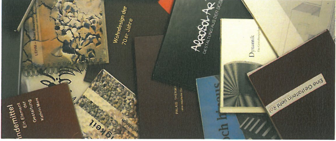
Individuelle Themenstellungen - individuell! Einzigartig - individuell! Erscheinungsbilder

Dämmung - Behagen oder Unbehagen Oberflächengestaltung mit Effektpigmenten aus Metall Beton im(itationen) Malerhandwerk Bindemittel - ein Element der Gestaltung Spanndecken Wall-Vintage Dynamik - ein Gestaltungselement Farbgestaltungskonzepte für Drolshagen Enkaustik Lehm - Putze und Farben Kalkputztechniken Glow in the dark - Gestalten mit phosphoreszierend. Farben Upcycling - Ein Konzept auch für Oberflächen Gestalten mit Klebebändern Aerosol Art - Gestaltung aus der Dose Fachwerkgestaltung Wohnen im Alter - Konsequenzen für die Farbgestaltung Corporate Identity im Malerhandwerk Darkshaping- Farbpräferenzen einer Szene Tadelakt Optische Täuschungen