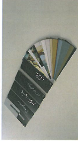
Farbfächer: Detail der Farbkollektion nach Sandro Botticelli

Ziel der Facharbeit ist ein anwendungsorientiertes Hilfsmittel für die Farbberatung beim Kunden um Farbkonzepten für Innenräume und Fassaden zu erleichtern. Dazu werden sechs vorkonfigurierte Farbharmonien erstellt und diese in Form von Farbfächern aufbereitet. Die Farbmuster werden in vier Analyseschritten (empirische Studie zur Farbwirkung/Erstellung einer Farbauswahl auf Basis der NCS Codierung/quantitative Zusammenstellung zu Farbharmonien/empirische Überprüfung der abstrakten Anmutungen) aus Werken der bildenden Kunst abgeleitet.