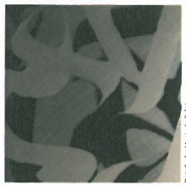
Detail der Musterkollektion